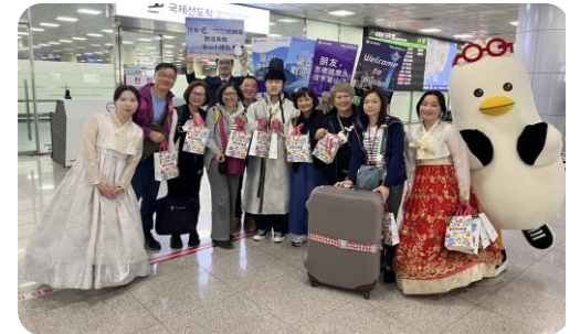
<중화권 관광객 환영행사>

* 국가적 동향(문체부): (중화권) 단체여행 연기, (아시아) 여행 취소 문의 지속, (미국) 여행사 프로모션 연기