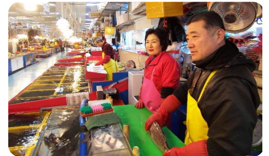
<자갈치 시장 상인>

* 소상공인연합회 긴급 실태조사(12.10~12): 매출 감소 경험(88.4%), 연말 경기 부정 전망(90.1%)